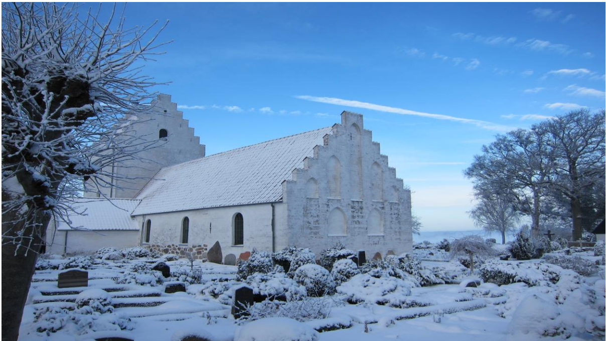
FØR CHRESTEN BERG

Byen er præget af Bogø Hovedgade med enkelte gårde, men ellers huse der i vidt omfang skyldes søfartsbefolkningen. De største af husene benævnes kaptajnshuse.